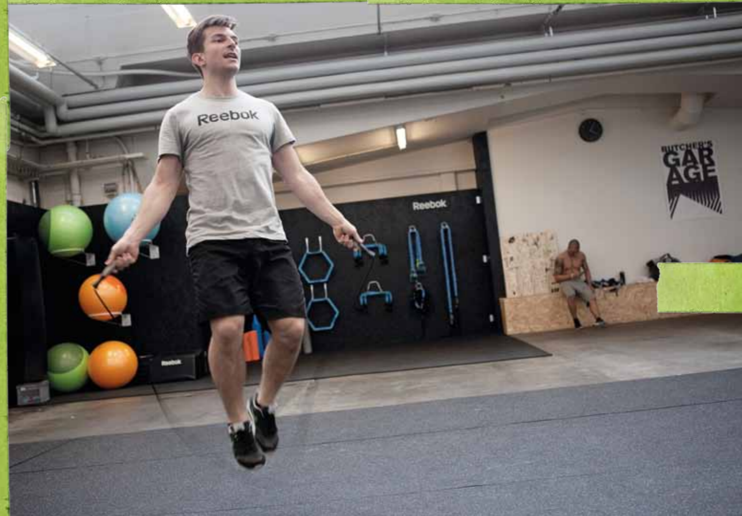
Reebok Stretch Box.

I Danmark har Reebok (Apparel) og MedicSport indgået samarbejde med Butchers Garage & Butchers Lab og har bygget og indrettet Stretch Box i Kødbyen og Valby.