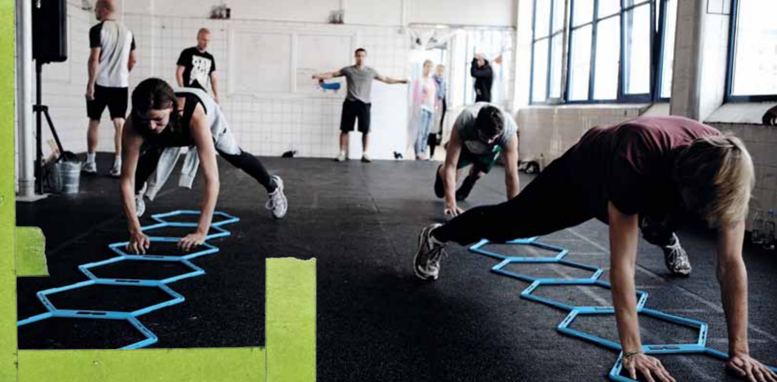
Holdtræning fra Butchers Lab.