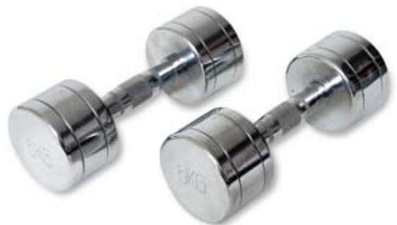
Krom håndvægtssæt 1-10 kg