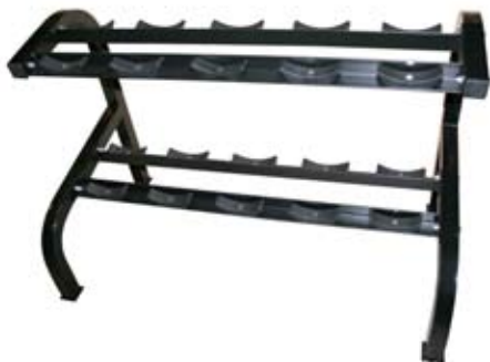
Rack til 5 par håndvægte - sort