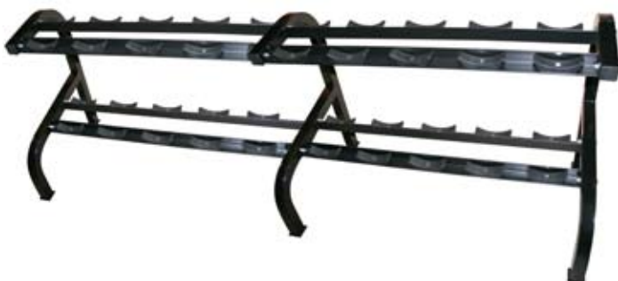
Rack til 10 par håndvægte - sort