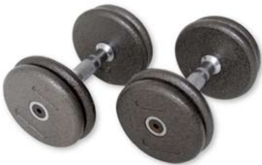
MedicSport jern håndvægte 5-40 kg