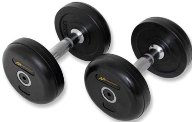
MedicSport pro gummi håndvægte 10-50 kg