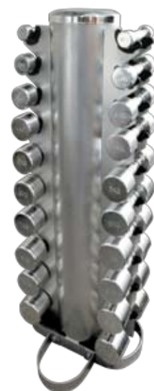
Rack til krom håndvægte – sølvgrå