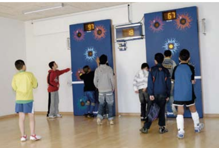
Globus1 - Århus

Globus1 er et multiaktivitetscenter ved Gellerup i Århus, der hele dagen er fyldt med børn og unge, som dyrker idræt i en forening eller leger, spiller og træner selvstændigt. Vi vil gerne tilbyde et spændende udvalg af forskelligartede aktiviteter og effektivisere deres træning på en sjov måde, og derfor købte vi MedicSports Sportwall. Det har været en god investering, der kommer områdetets børn og unge til gode.