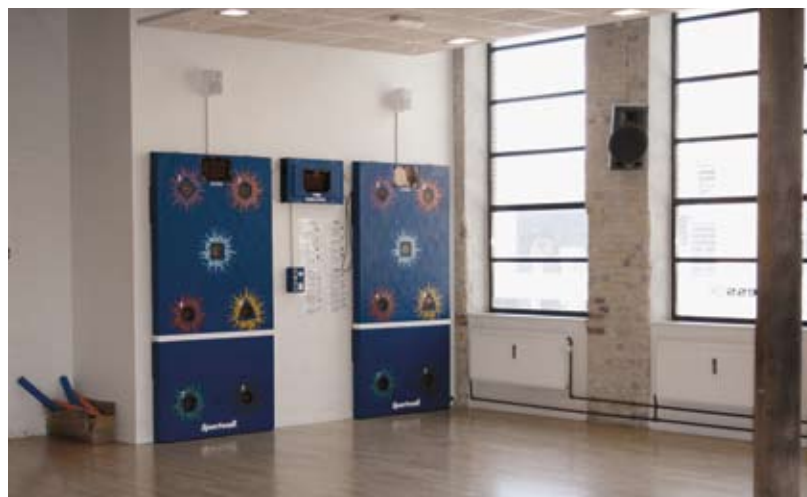
FitnessDK - Valby