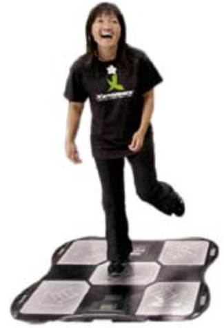
Pump It Up plade